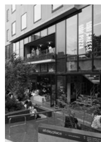
2022.8 Vol.67 No.8 表紙写真／オールデイブレイス渋谷 (P.112)

STAFF 編集長／塩田健一 副編集長／車田 創 編集／玉木裕希 柴崎慎大 平田 悠 村上桂英 金子紗希 DTPデザイン／宇澤佑佳(SOY) 広告／三木亨寿 岡野充宏 小杉匡弘 雨宮 諒 販売／工藤仁樹 山脇大輔 愛読者係／関根裕子 経理／村上琴里 支社／武村知秋(広告) アート・ディレクション／BOOTLEG レイアウトデザイン／BOOTLEG + 宇澤佑佳 印刷／図書印刷株式会社