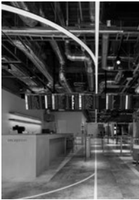
2026.1 Vol.71 No.1 表紙写真／ ターミナル・ゼロ・ハネダ(P.104)

STAFF 編集長／塩田健一 副編集長／車田 創 編集／平田 悠 村上桂英 林里菜子 中村雪乃 三谷咲樹 DTPデザイン／宇澤佑佳(SOY) 広告／小杉匡弘 岡野充宏 雨宮 諒 販売／工藤仁樹 関根裕子 経理／村上琴里 支社／武村知秋(広告) ロゴデザイン／尾原史和 レイアウトデザイン／宇澤佑佳 印刷／株式会社広済堂ネクスト