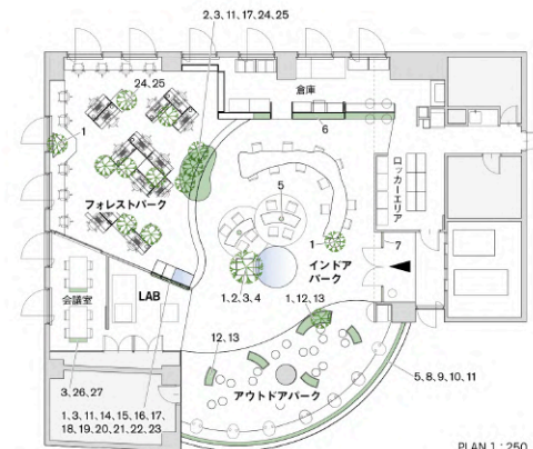
PLAN 1 : 250