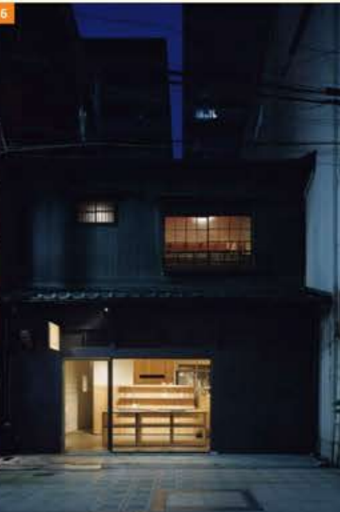
1. 設計を手掛けた小泉誠さん (Koizumi Studio) デザインの珪瑯ドリップケトル「kaico」シリーズ 2. 2階客席には、落語やワークショップなどのイベントスペースとしても使用される小上がりの箱部屋を設けた 3. 箱部屋は国産の杉材パネルを使用しており、角度を揃って配することで空間に奥行きと多様性を生み出す 4. 母屋から中庭を抜けた先にある蔵も、客席として設えられた 5. 既存梁を現した1階物販スペースを中庭方向に見る。国産の杉材三層クロスパネルを使用した什器は、すべてオリジナル 6. ファサード夜景。築70年の町家建築を改装した。屋根は既存瓦を葺き直し、元の建物の姿を残している