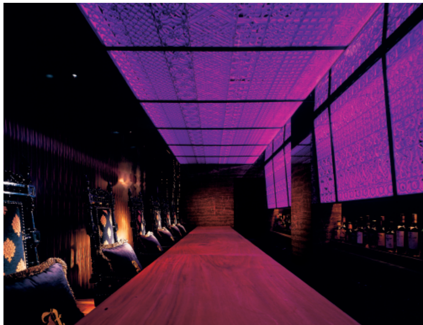
LEDとミラーを用いて発光するカウンターバックの壁面と天井。それぞれ色の变化や照度が調整できる。見えている模様は化粧金物によるパターン