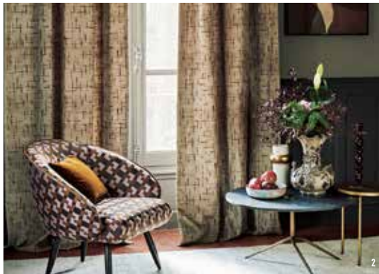
1. ZIMMER+ROHDE「COMFY BOUCLÉ」2023年の新作。柔らかさとボリューム感があり、表情豊かなカラーメランジュが特徴の椅子生地 (W1400) 57,420円/m 2. ardecoral「Dipint」天然の山嵐観から作られるタッサンシルクで織られたドレープカーテン (W1400) 61,160円/m. ardecoral「Vasari」滑らかな風合いのジャカード織による椅子生地 (W1400) 49,940円/m 3. チエルシーインターナショナルのショールーム内観