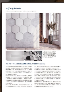
取材記事掲載イメージ

※プラン 1、2 とも取材記事と製品記事はウェブメディア『id+』にも転載します。