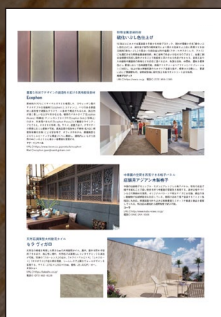
製品記事掲載イメージ