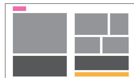
記事2ページ(見開き)