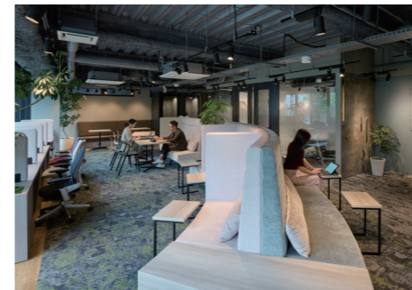
The Place 建築監修/ヴィス デザイン/建築 IAO 竹田設計 内装 ヴィス 撮影/近藤泰岳(『商店建築』2021年11月号掲載)