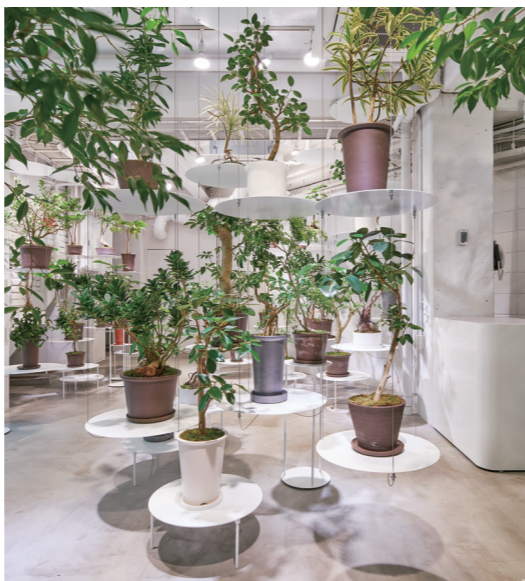
REN 設計 / NOSIGNER アナザーアパートメント 撮影 / 高木康広 [商店建築]2021年12月号ボタニカルショップ特集より

植栽 / 壁面緑化 / 屋上緑化 / 造園 / ランドスケープデザイン / アウトドアファニチャー / 人工芝 / フェイクグリーン / 造花 / プランター / グリーンレンタル / ボタニカルショップ / デッキ材 / 屋外用照明器具 ほか