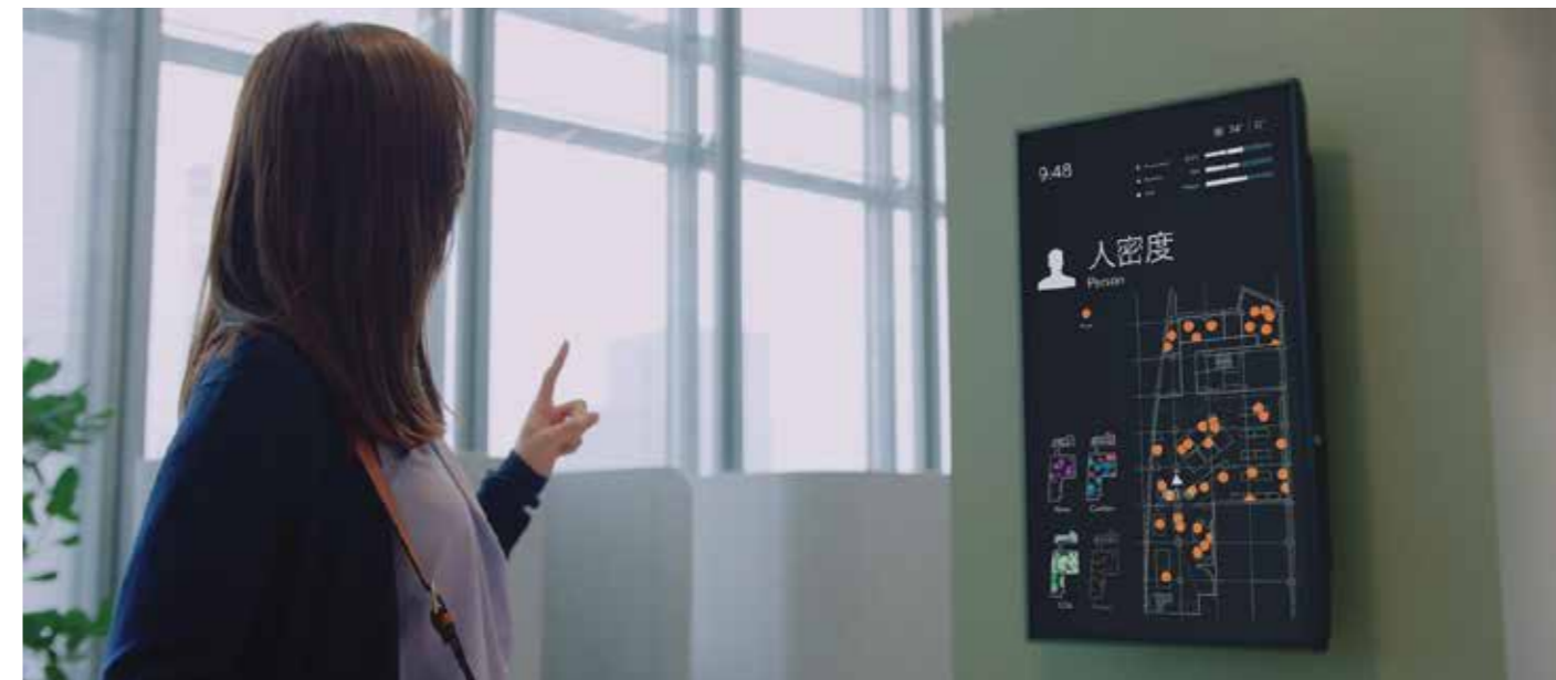
「worXlab」(商店建築)2022年4月号掲載物件)エントランスに設置された空間見える化ソリューション

省人・省力化、可視化、非接触、キャッシュレスなど新しい時代に求められる設備や機器を紹介