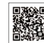
誌面掲載イメージ