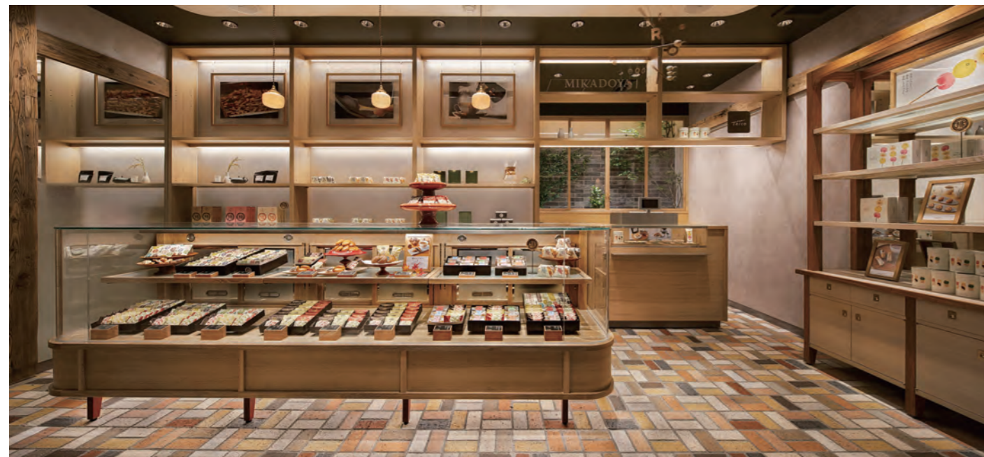
御門屋 中目黒店 設計/ROWEDGE INC. 施工/LIBERTY CORPORATION(名古屋モザイク工業 第6回デザインアワード 2021 非住宅部門全賞受賞)

タイルや石材は、建築や内部空間に耐久性と意匠性をもたらす重要な建材です。今日ではデジタルプリントを駆使したもののや、リサイクルなどで環境に配慮した製品、ダイナミックな大判サイズの展開など多彩な新製品が見られるようになりました。さらに、今年では日本で「タイル」という名称に統一されて100周年の節目でもあります。本企画では、時代を経ても変わらぬ魅力を持つタイルやレンガ、石材を施工例とともに紹介します。