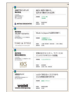
1/4P サイズ求人広告掲載例

※当号で予定しておりました編集連動広告企画「公園・屋外施設向け建材&設備」は、編集特集の掲載月号変更により、4月号に実施することになりました。お詫びして訂正いたします。