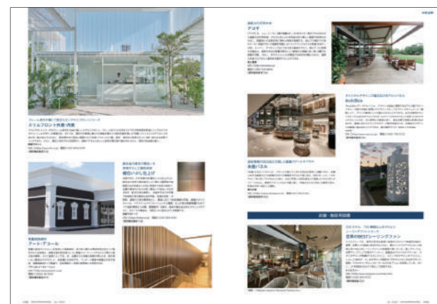
2022年1月号掲載ページ