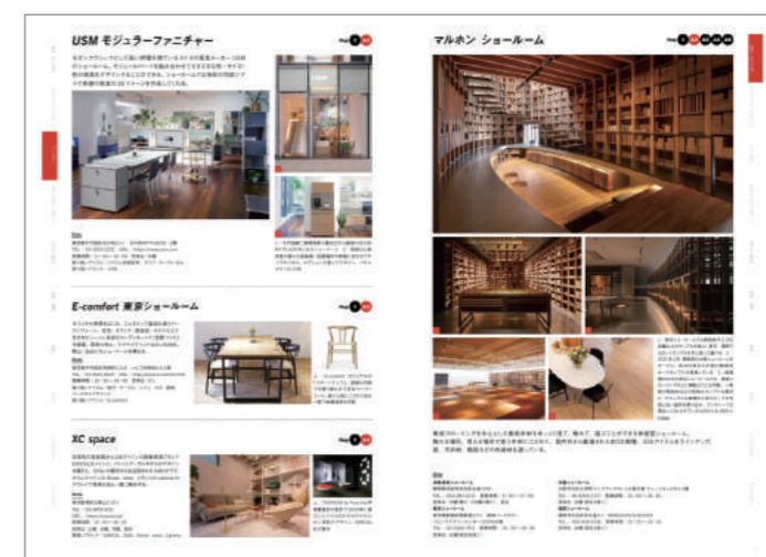
1ページ、1/2、1/4ページ掲載例

店舗や各種施設に向けた建材や設備のショップ&ショールームの情報を集めて特別編集。『商店建築』誌に挟み込むブックインブック方式で制作します。ショップやショールームを開設されている企業様にご利用しやすいよう、特別な協賛広告料金を設定しています。また、弊社が運営するWebサイト[id+ (インテリアデザインプラス)]に、[id+SHOP & SHOWROOM GUIDE for Professional]を開設。誌面に掲載した情報に加え、Webショールームへのリンクや提供動画の掲載も可能。掲載イメージや前回実績など、詳しくは別紙企画書をご覧ください。