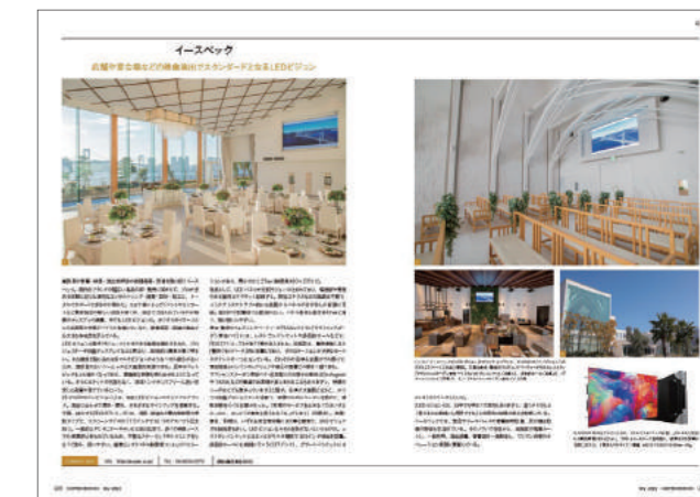
誌面掲載イメージ(2ページ)