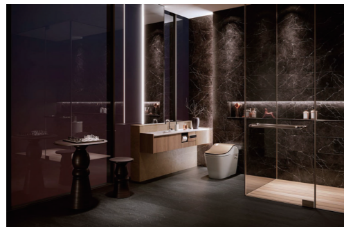
前回(2022年12月号)記事掲載ページ→