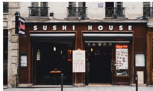
前回(2022年12月号)記事掲載ページ→