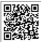
前回(2023年1月号)記事掲載ページ→

内装材：コーワ、竹松工業、サンゲツ、タニハタ、アドヴァングループ、みはし、ノスタモ、パネフリ工業、東リ、アルベロプロ、イビケン、ウッドワン、竹定商店、オムニツダ 内・外装材：日本玉石、エービーシー商会、菊川工業、光栄プロテック、竹中金網、AGC、プラン21コーポレーション、田中機販、ユニオンビズ 店舗・施設用設備：棚橋工業、パナソニック エレクトリックワークス社、ヘルシーロースター、EcoSmartFire、ホシザキ、スガツネ工業、タニコ、SFA Japan、ビューティガレージ、ユー・ビー・コム、ハナムラ 換気空調・消毒：ケイエスシー、コンデアヒュミライフ・ジャパン 照明・サイン：稲葉電機、発研セイコー、カラーキネティクス・ジャパン、アリストジャパン、タカショーデジテック、セイビ堂、EL JEWEL、ケイ・プロジェクト (順不同・敬称略)