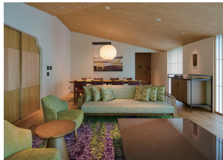
紫翠 ラグジュアリーコレクションホテル 奈良(「商店建築」11月号掲載 撮影/近藤泰岳)