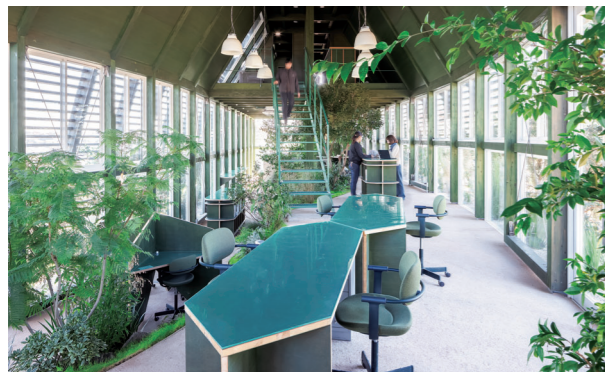
KEEP GREEN HOUSE(設計/SUEP、植栽計画/DAISHIZEN [GREEN is vol.4]掲載)

よりよい働き方を実現するオフィス・ワークプレイス・生産拠点。その実例および関連製品、サービスを紹介